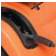
Palanca de alzamiento de la plataforma asistida por gas