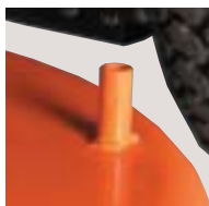
Tubo de conexión a manguera para limpieza de la plataforma